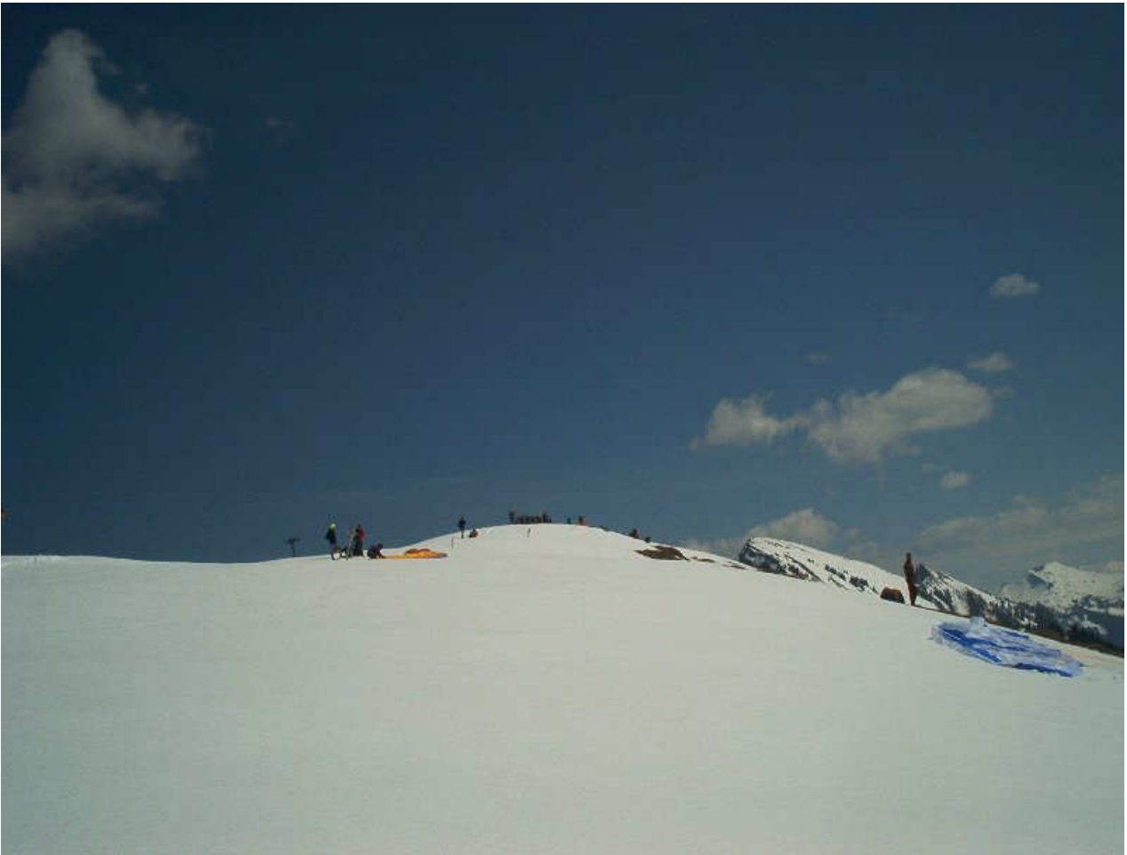
Tolle Winterkulisse am Startplatz