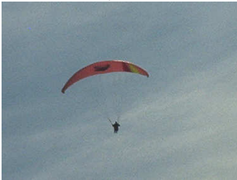
Vermutlich ein Testpilot mit dem neuen Edel