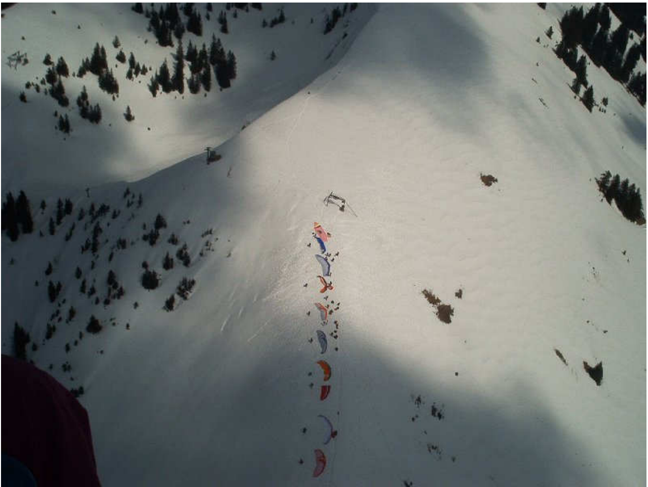
Der Winterstartplatz in Bezau aus der Luft