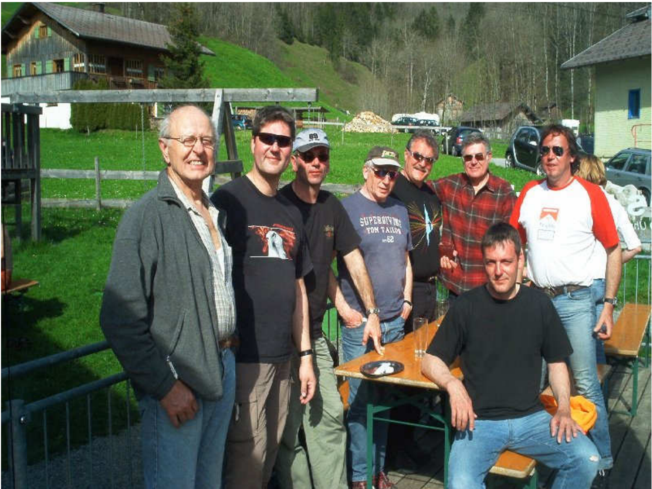
Die ausgelaugten Fetzenflieger

Nachdem das Wetter zuerst nicht mitspielen wollte, hat es dann beim dritten Anlauf doch geklappt. Der Samstag war noch kein überragender Flugtag, vor allem die Windrichtung wollte nicht stimmen. Der Sonntag zeigte sich dann von der besseren Seite. Nach einer Stunde Wartezeit an der Kabinenbahn und einer zehnminütigen Auffahrt konnte die Schneewanderung zum Winterstartplatz angetreten werden. Der hohe und weiche Schnee bereitete den meisten noch kleinere Startprobleme. Nachdem diese überwunden waren, trafen sich einige wieder an der Wolkenbasis. Alles in allem war es ein schönes Flugerlebnis.