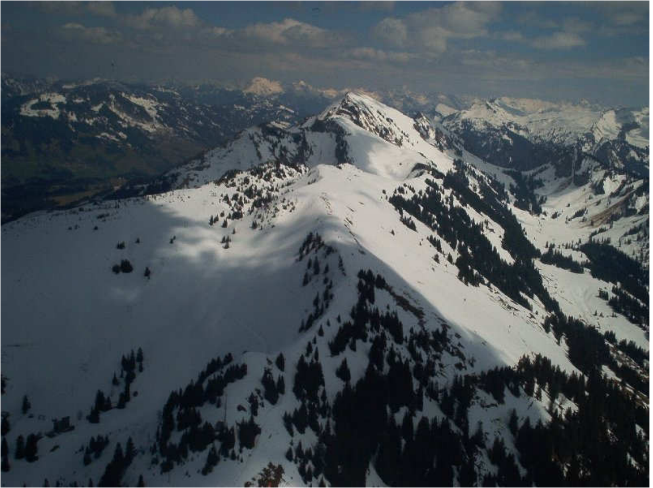
Erlkönig am Himmel